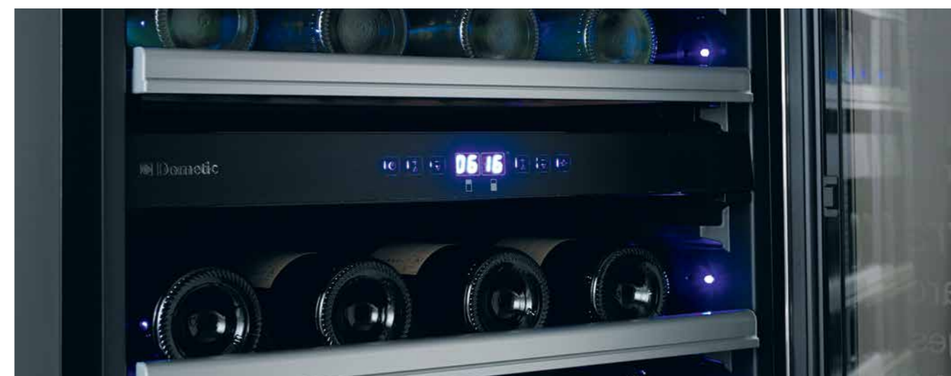
Zones de température séparées pour les vins rouges et les vins blancs.