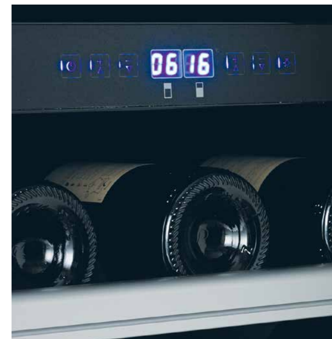
Panneau de commande Touchpad et affichage numérique de température