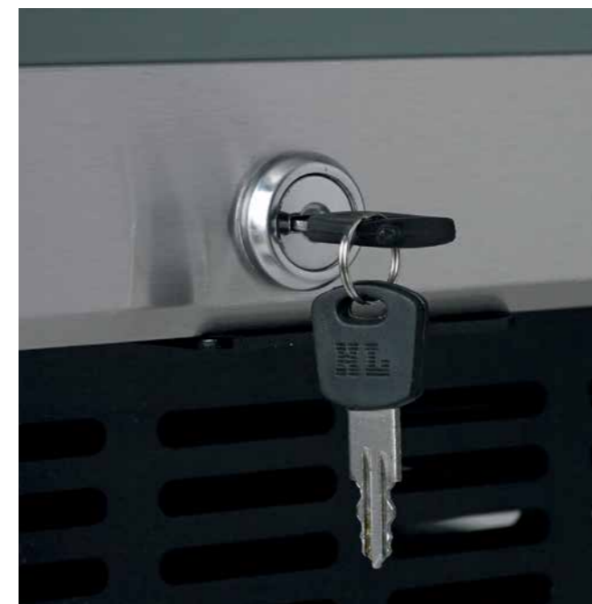
Porte verrouillable, 2 clés fournies à la livraison