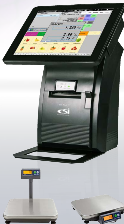
Liaison avec balances METTLER TOLEDO