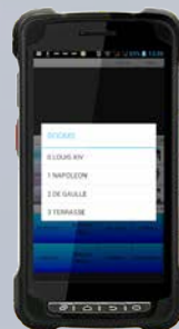
SELECTION DES SALLES