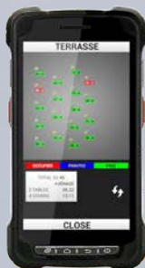
PLAN DES SALLES